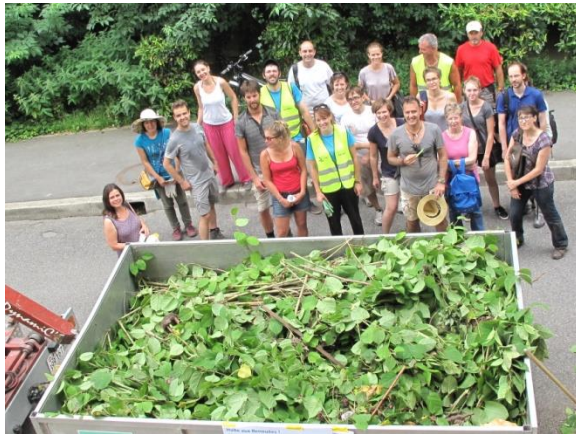
En 2017, 4200 kg de renouées ont été arrachés lors de l'action citoyenne à Morges.

La biodiversité locale est menacée par cette espèce très dynamique qui a développé une véritable stratégie de compétition envers les autres plantes : la sécrétion de substances au niveau des racines fait mourir les végétaux avoisinants et ses feuilles denses empêche tout développement d'autres espèces par manque de lumière. De plus, sa croissance très rapide lui permet d'occuper rapidement tout l'espace.