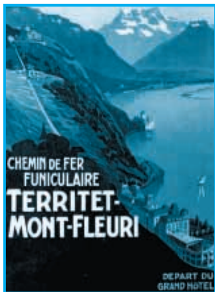
Essort précoce du tourisme

Le Léman entre dans la civilisation avec les villages lacustres, du Néolithique à l'Age du Bronze. Un chapelet serré d'une quarantaine de stations borde les rives, moins abruptes, du Grand et du Petit lac, à l'ouest de la diagonale Thonon-Cully. Le Léman est un haut lieu des fameuses « cités lacustres », dont les descriptions par les préhistoriens du XIX e siècle fascinent l'imaginaire du public.