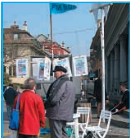
Le stand de l'ASL à Vevey et à Genève