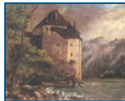
Gustave Courbet, Château de Chillon, vers 1875, huile sur toile, 54x65cm.

mières pentes des coteaux travaillées par l'homme et plantées de châtaigniers, de peupliers, de platanes, de vignes en terrasses. Tout un paysage donc, identitaire et patrimonial, s'enracine dans des lieux devenant prestigieux et attractifs sous la double médiation d'une élite sociale «éclairée» et d'artistes aussi bien