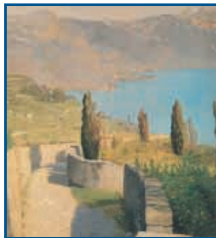
Felix Vallotton, Paysage du lac de Chexbres, 1892, huile sur bois, 35x27cm. Lausanne, musée Cantonal des Beaux arts.

lac se situe le plus souvent en plan médian dans son écrin de verdure. Jusqu'à ce que l'imaginaire romantique hanté par les contrastes sublimes sélectionne les scènes majestueuses des roches sauvages plongeant dans le lac. Le haut-lac l'emportera alors sur «le lac de Genève» ou de Lausanne, la tempête sur l'eau utile et aimable, la brume sur l'atmosphère dégagée et lumineuse. Mais voit-on le lac pour lui-même ou comme simple faire-valoir du cadre et des montagnes? L'horizontalité n'est-elle pas alors tout simplement le complément indispensable à une mise en scène de la verticalité? L'eau est-elle fondamentalement valorisée? Sans doute, d'une certaine manière. Mais c'est surtout dans la deuxième moitié du XIX e siècle, au temps du paysagisme triomphant, que le lac, comme toute eau calme et dormante, occupera dans l'imaginaire de l'artiste une place de choix: jeux fugaces de lumière et effets de miroir au soleil couchant formeront les thèmes privilégiés d'une ambiance lacustre valorisée. Bocion, Hodler... et tant d'autres nous ramèneront au bord de l'eau, au bord du lac, au bord d'un Léman qui s'anime progressivement du loisir des hommes.