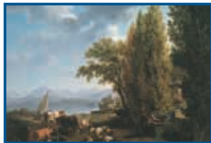
Pierre-Louis de la Rive, Vue de Sécheron-Dessous, 1790, huile sur toile 126x168cm. Genève, musée d'Art et d'histoire.

lise et se diffuse dès le XVIII e siècle dans la «bonne société» en liaison avec la vogue du sentiment de la nature. De la poésie au roman en passant par le goût nouveau du jardin paysager, les eaux dormantes prennent une nouvelle valeur associée à un imaginaire artistique et contemplatif. Quoi de plus agréable que de se reposer au bord de l'eau pour rêver, méditer, pour se laisser aller à une douce mélancolie? L'imaginaire rousseauiste induira de nouvelles pratiques et un nouveau sens du lac s'incarnant par ailleurs dans des lieux précis (Clarens, Meillerie), dans des paysages quasiment «archétypaux». Quoi de plus agréable également qu'un tableau cadré sur l'eau-miroir reflétant les objets environnants comme si la nature se faisait elle-même? La peinture de paysage va bientôt prendre le lac comme motif en même temps que s'invente en Angleterre la mode du voyage pittoresque à la recherche de contrastes frappants voire surprenants. Une véritable géographie imaginaire du lac va ainsi se structurer avec ses cadrages particuliers, ses vues valorisées, ses points de vue incontournables, ses objets sélectionnés.