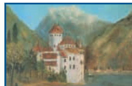
Maurice Utrillo, Château de Chillon, 1915-16, huile sur toile, 56x64cm. Coll particulière.

peintres qu'écrivains ou musiciens. Clarens toujours, mais bientôt Montreux, Amphion, Evian, etc... Tout un paysage c'est-à-dire une image du pays, une image «immortalisant» – le mot n'est pas trop fort – certains lieux ou plutôt un certain point de vue sur ces lieux, un certain cadrage redondant produisant autant de stéréotypes paysagers. Lieux et peintres, peintres paysagistes et lieux: une osmose patrimonialisant certaines portions du territoire au nom d'une jouissance esthétique et contemplative, au nom d'une beauté érigée en œuvre d'art et qu'il faut impérativement goûter des yeux. Ainsi en est-il du château de Chillon par exemple, patrimoine triplement culturel de par son histoire, son architecture, mais aussi sa mise en paysage par Courbet et – entre autres – Utrillo, mise en paysage reprise presque sous le même angle par certaines publicités touristiques (telles que les affiches des CFF en 1928). Le patrimoine dans ce cas, est-ce le château ou le château en paysage dans son environnement lacustre et montagneux? Les deux évidemment, indissolublement: le matériel et le modèle perceptif qui lui donne du sens et l'intègre à notre géographie imaginaire.