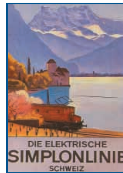
Emile Cardinaux, Plakat für SBB-CFF-1928. Museum für Gestaltung-Zürich, Photoglob Zürich/Vevey.

naire). D'autres imaginaires coexistent – on l'a entrevu – et construisent d'autres géographies rompant parfois assez brutalement avec les précédentes. Ce fut le cas, à partir des années d'Entre-deux-Guerres, d'un imaginaire centré beaucoup plus sur l'action que sur la contemplation, sur l'eau et ses pratiques que sur le paysage. Imaginaire du bain, imaginaire des sports nautiques créant de nouvelles géographies et de nouveaux territoires. Imaginaire de la plage et de l'hédonisme. Est-ce un nouveau patrimoine? Assurément une nouvelle culture avec ses lieux, ses réseaux, ses représentations, réinterprétant le lac en fonction de nouvelles visions. Mais attention de ne pas substituer purement et simplement des visions du lac fondées sur des rapports d'appropriation et de participation, visions assez significatives du geste sportif, aux visions