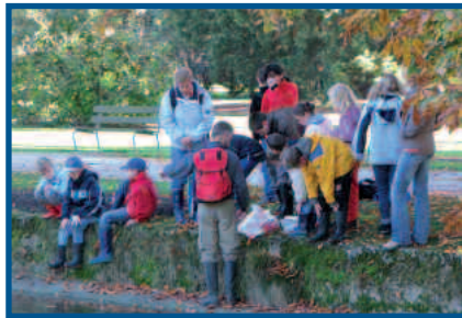
Passeport vacances Morges

L'ASL aménage des vitrines, participe à des expositions. Bénévoles et permanents accueillent les visiteurs lors de manifestations