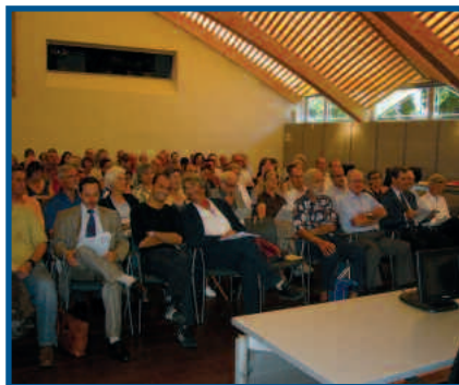
Un auditoire attentif lors de l'Assemblée générale à Nyon