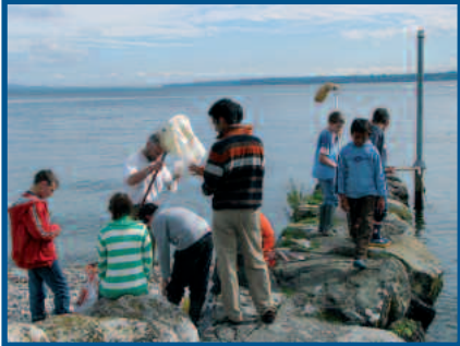
Passeport vacances Genève

Deux maîtres mots surtout quand il s'agit des jeunes , car demain ce sont eux qui prendront en main la destinée du Léman et de ses rivières. L'ASL met donc sur pied chaque année en été et en automne passeports et camp de vacances tout autour du Léman.