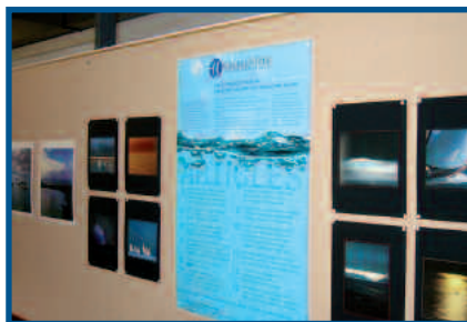
Expo ASL – Bibliothèque de la Servette, Genève