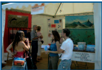
Fête du Développement Durable

L'ASL aménage des vitrines, participe à des expositions. Bénévoles et permanents accueillent les visiteurs lors de manifestations