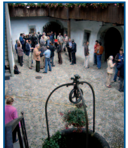
Forum des Communes, Lutry

Stimuler l'échange entre communes, valoriser leurs expériences, rendre compte de leurs défis: la raison d'être du Forum des communes lémaniques pour une gestion durable des eaux que l'ASL a organisé en mai 2007 au Château de Lutry.