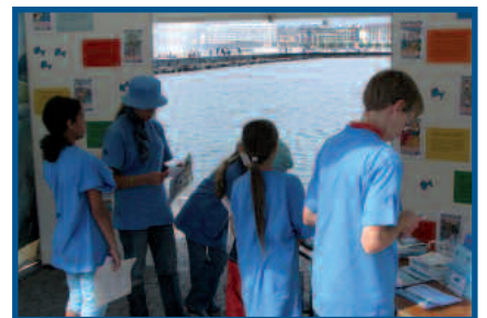
Stand ASL à Net'Léman