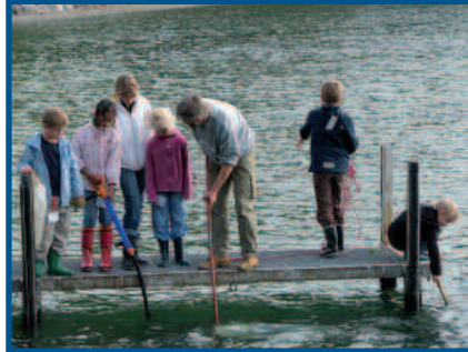
Passeport vacances Rolle