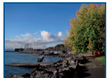
Conception et textes: Gabrielle Chikhi-JANS

der cette problématique, plus particulièrement ses effets sur la santé - voir Lémaniques 62. En l'état actuel de la recherche, les études scientifiques ne permettent pas de tirer des conclusions indiscutables. Il faut donc suivre attentivement cette problématique à l'avenir.