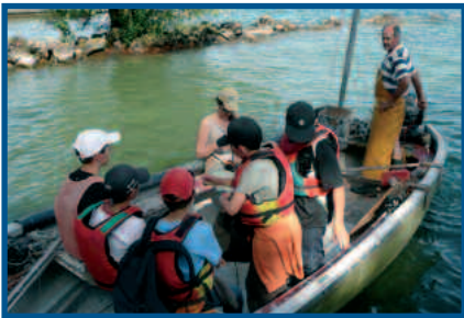
Camp de vacances Versoix