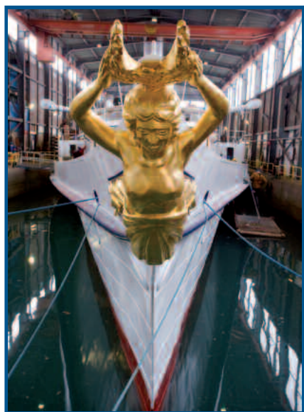
La Suisse , Figure de proue, © Jean Vernet

l'avant du pont principal et non plus dans l'entrepont comme sur la plupart des autres bateaux, il ne s'agissait pas d'une simple buvette mais bien d'un café-brasserie confortable séparé des coursives par une paroi. Il se composait de meubles et boiseries en acajou avec des panneaux en loupe de frêne et des incrustations de citronnier. Sa réalisation fut confiée à Constant Vez, maître-ébéniste lausannois de grande renommée. De tous les vapeurs