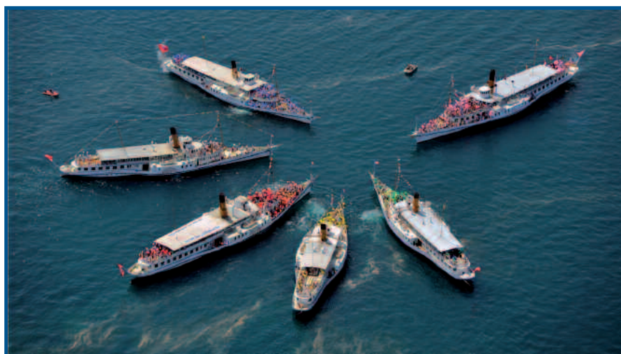
Parade navale, Rolle, 24.05.09

ABVL - Case postale CH-1815 Clarens-Montreux tél. +41(0)21 925 21 59 - +41(0)79 449 16 46 fax +41(0)21 925 21 55 www.abvl.ch - info@abvl.ch Souscription à l'augmentation de capital de la CGN jusqu'au 30 octobre 2009 pour la rénovation et remise en service du bateau Italie : tél. +41(0)21 614 62 33 www.cgn.ch