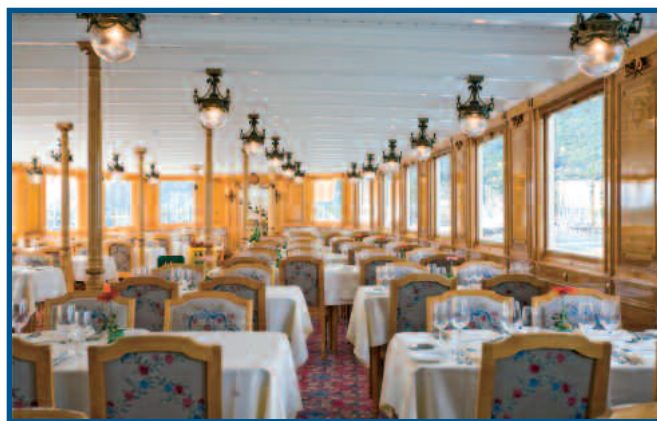
La Suisse , Salon 1 re classe, © Jean Vernet.

Les recherches minutieuses menées ces dernières années au sein de l'Association Patrimoine du Léman (APL) ont permis l'élaboration du projet de restauration à l'identique, dans les règles de l'art et avec le concours des meilleures entreprises suisses et françaises, de la magnificence du plus grand bateau lancé sur les eaux suisses à l'époque. La CGN avait souhaité, en 1908, que le salon de 1 re classe de La Suisse soit en rupture avec tout ce qui avait été fait jusqu'alors: le cahier des charges imposait le recours au style néoclassique «à la française». L'ébénisterie d'art «Les fils d'Henri Bobaing» à Lausanne remporta l'appel d'offres ayant suscité pas moins de neuf projets. Sa proposition en érable sycomore entremêlant des marqueteries au motif de couronnes de roses et autres attributs romantiques du style Louis XVI en bois sculpté fit l'unanimité. La lustrerie en bronze ciselé créée tout spécialement, les tapisseries de sièges des manufactures d'Aubusson ainsi que le tapis de sol parsemé de couronnes de roses rehaussaient encore cette impression de prestige que la Compagnie désirait instiller au bateau amiral de sa flotte. Quant au salon de 2 e classe, situé à