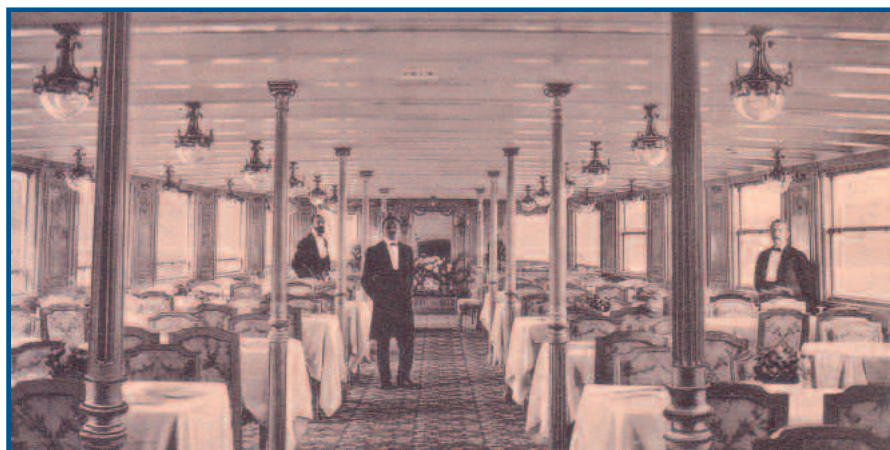
Grand salon du bateau-amiral La Suisse II (1910)

La CGN annonce qu'elle souhaite maintenant rénover partiellement son «bateau-amiral», le vapeur La Suisse (1910), mais doit arrêter en même temps l' Italie , pour des raisons de