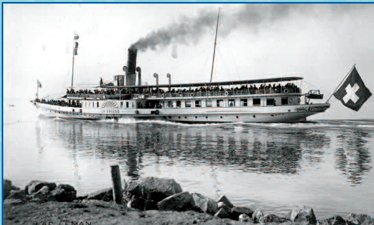
Le bateau La Suisse II , joyau de la Belle Epoque

tion sur les fleuves et les lacs et il allait se construire des milliers de bateaux de ce type jusque dans la seconde moitié du XX e siècle. De toute cette production, à peine plus d'une cinquantaine d'unités subsistent encore aujourd'hui en état de marche et effectuent des services réguliers: un en Australie et en Nouvelle Zélande, deux sur le Nil, à peine plus en Amérique du Nord, sans