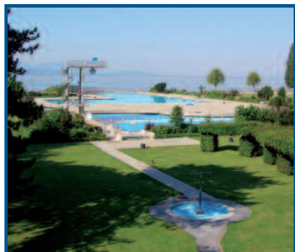
La piscine de Bellerive-Plage

Ouverte à tous, cette journée est organisée par l'ASL en collaboration avec de nombreuses associations en lien avec le Léman et les sports aquatiques. Diverses activités – qui