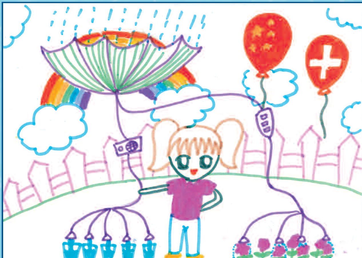
Fruit de l'imagination débordante d'une petite Chinoise qui a participé au concours de dessin organisé dans le cadre des manifestations qui ont eu lieu au pavillon Better Water Best Urban Life de Bâle, Genève et Zürich à l'Exposition universelle de Shanghai.

L'ASL vous souhaite une année 2011 fertile en événements heureux