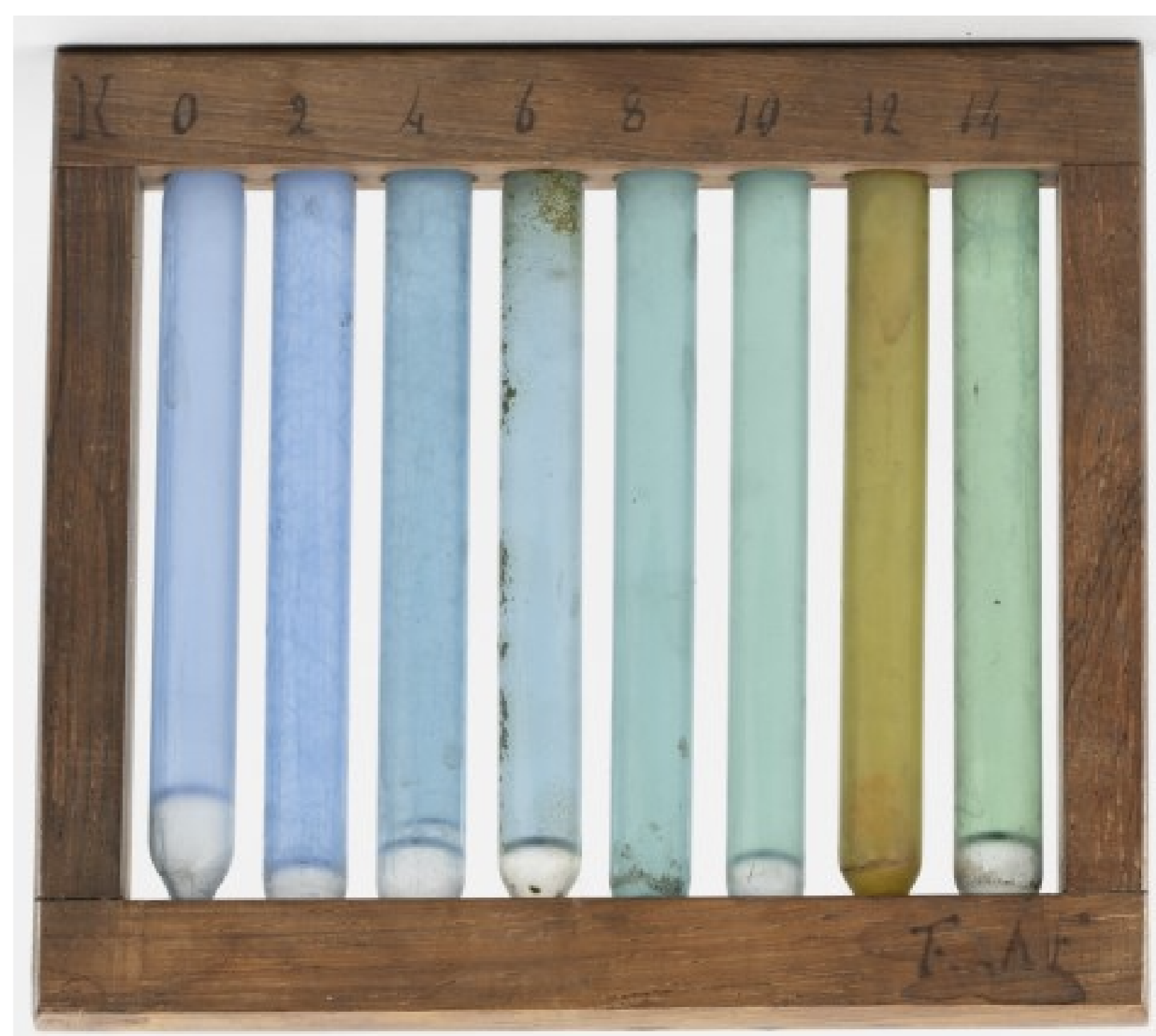
Echelle de couleurs ayant appartenu à F.A. Forel, lui permettant de décrire les différentes couleurs du lac. Ensemble de 8 tubes de verre remplis d'un liquide auquel différents additifs sont ajoutés pour obtenir les différentes teintes. Les mélanges sont décrits dans Forel, 1895, le Léman, tome 2, page 462-487. Les tubes sont numérotés 0, 2, 4, 6, 8, 10, 12, 14. Cette Échelle de couleurs est visible au musée du Léman.

Campus n°101 (Magazine scientifique d'UNIGE)