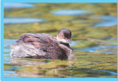
Grèbe à cou noir