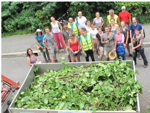
En 2017, 4200 kg de renouées ont été arrachés lors de l'action citoyenne à Morges.

La biodiversité locale est menacée par cette espèce très dynamique qui a développé une véritable stratégie de compétition envers les autres plantes : la sécrétion de substances au niveau des racines fait mourir les végétaux avoisinants et ses feuilles denses empêche tout développement d'autres espèces par manque de lumière. De plus, sa croissance très rapide lui permet d'occuper rapidement tout l'espace.