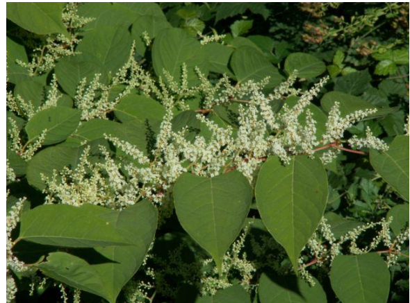
Bien que décorative, la Renouée fait de l'ombre à la biodiversité.